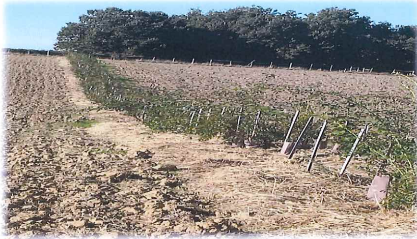
Premier tronçon de haie : opération menée avec succès